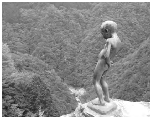
祖谷温泉名物小便小僧

本レポートは、前号にて紹介予定でしたが、紙面の関係で本号の掲載になりました事をお詫びいたします。 編集局