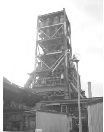
サスペンションプレヒーター付きキルン

す。ここまでが「資源事業」となります。次に、工場内にて石灰石と粘土を調合した粉末原料をサスペンションヒーターにて1450度で焼成し、クリンカ(半製品)を作ります。これに石膏を加え、セメントミルで粉碎し、セメント(製品)となります。工場内施設見