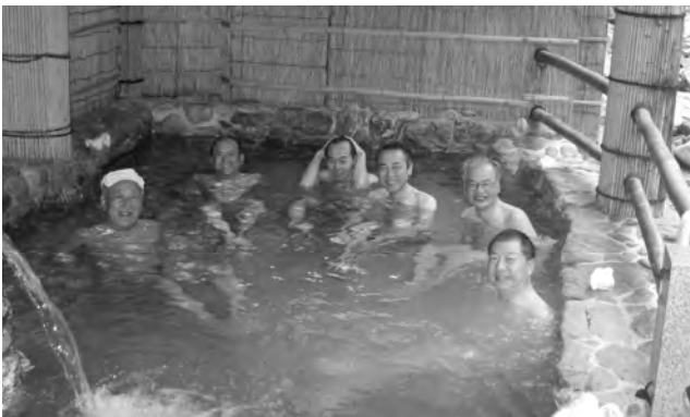
祖谷温泉露天風呂

らに場所を大歩危に移し、またまた遊覧船にて景観を楽しみました。いずれも紅葉は3分といったところで、あと2週間遅ければ、紅葉もすばらしかったと思われそうです。とはいえ、週間天気予報では雨だったのが、好天に恵まれましたので、まずは良しとさせていただきたく思います。その後、のんびりと淡路島を縦断し、明石大橋を渡り、帰阪いたしました。