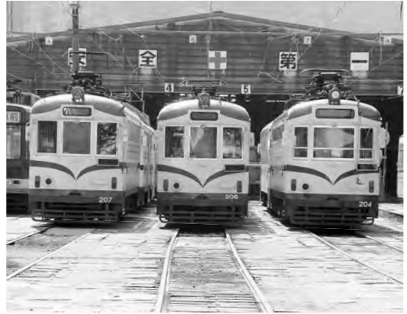
高知電鉄棧橋車庫にて