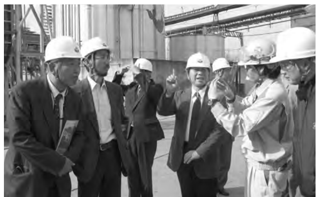
説明を聞くメンバー

学でサスペンションヒーター付ロータリーキルンの直下を歩いたのですが、10m以上離れているにもかかわらず、熱気で少し汗ばみました。個人的な話ではありますが、何故か熱気を感じながら「工場はこんな風に力強くないとな。」とってしまいました。これが「セメント事業」です。このセメント製造の工程に密接に関係しているのが、「発電事業」と「環境事業」です。土佐工場様は石炭焚自家発電設備を保有され、キルン及びクーラーの排ガス等を利用して発電を行い、工場内で使用する電力のほとんどをまかない、余剰電力を小売されておられます。これが「発電事業」です。最後に問題の「環境事業」ですが、セメントの製造過程で、原料を1450度という高温で焼成させるため、ほとんどの廃棄物を無害処理することが出来るそうです。この特長を生かし、各産業から排出される産業廃棄物を引き取り(勿論、ビジネスとして有償で)、セメントの原料や燃料とされておられます。