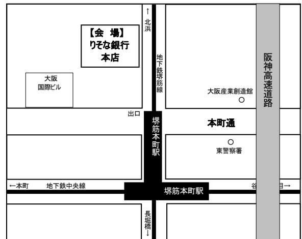
(地下鉄堺筋線「堺筋本町」①出口下車北へ徒歩1分)